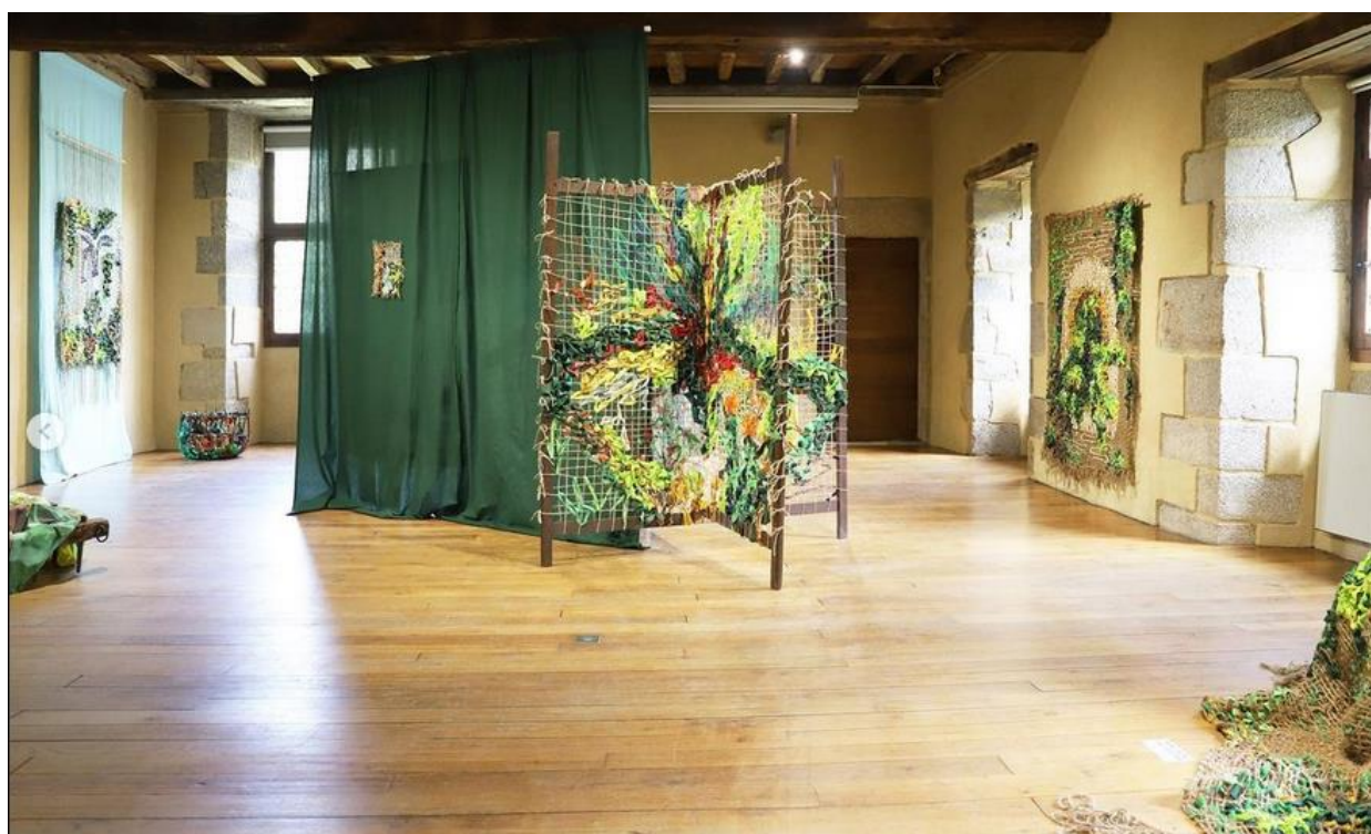
« Les sentiers Délaiésés » Cassandra Boucher - 2023