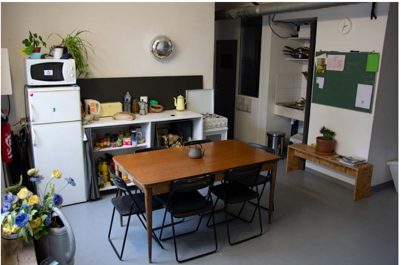
Vivarium - Parties communes

Pour tout renseignement ou visite de l'atelier, les artistes intéressé·e·s peuvent adresser un courriel à la même adresse.